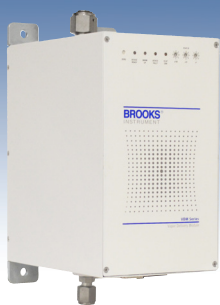
VDM300 水蒸気デリバリーモジュール